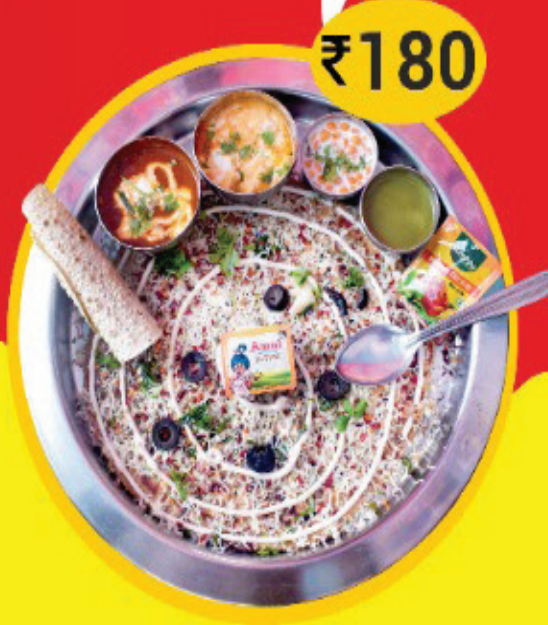
Pizza Paratha Thali