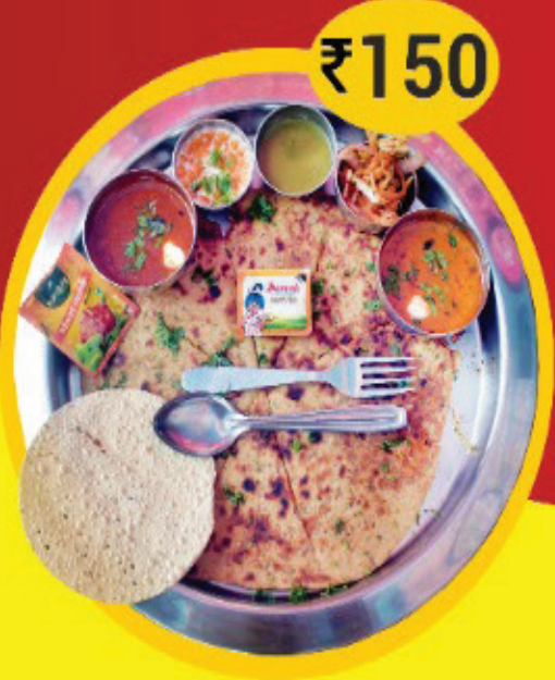
Mix Veg Paratha Thali