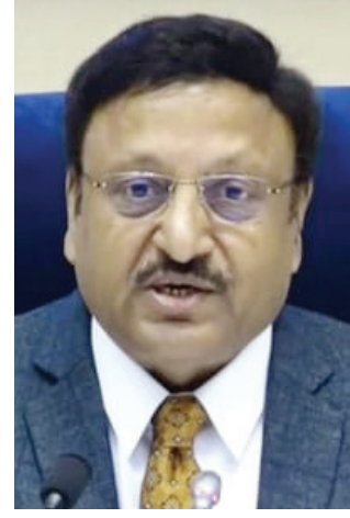
आघाडीकडून देखील जिल्ह्यातील उमेदवारांची घोषणा करण्यात आली

विधानसभा निवडणुकांचे निकाल घोषित होतील. केंद्रीय निवडणूक आयोगाने पत्रकार परिषद घेत याबद्दलची मोठी घोषणा केली आहे. विधानसभा निवडणुकांची घोषणा होताच महाराष्ट्रात आचारसंहिताही लागू झाली आहे. सातारा जिल्ह्यातील आठ विधानसभा मतदार संघात निवडणूक आयोगाकडून आचार संहितेची घोषणा होण्यापूर्वीपासूनच घडामोडींना वेग आला आहे. महायुती विरुद्ध महाविकास आघाडी अशी लढत सातारा जिल्ह्यात पहायला मिळणार आली तरी वचित बहुजन