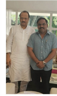
पुणे (द. आरंभ पर्व)