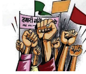
आपली व्यथा मांडणार आहेत.

भूगाव,जि. पुणे येथील फॉरेस्ट ट्रेल्स टाऊनशिप मध्ये राहणाऱ्या रहिवाशांना विकासकाकडून (पराजपे स्कीम) अशा अचानक पाणी कपात केली जाते आणि वीज पुरवठा ही वारंवार खंडीत होत असतो. गेल्या अनेक वर्षांपासून फॉरेस्ट ट्रेल्समध्ये पाणी बंद होण्याच्या आणि वारंवार वीज न्याय मिळत नाही. त्यामुळे त्रस्त रहिवाशी पीएससी हाऊस, केतकर पथ एरंडवणे, पुणे येथे 6 जानेवारी 2025 रोजी सकाळी 11 वाजता मूक आंदोलन करून