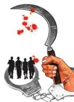
कोयता गॅंग ने केलेल्या हल्ल्यामुळे या तरुणाला आपल्या हाताचा पंजा गमवा लागलेला

तीन ते चार दिवसांपूर्वीच पुण्यामध्ये मोशल मीडियावर कोयता हातामध्ये घेऊन फोटो पोस्ट केल्याची घटना ताजी असतानाच आता पुन्हा पुन्हा पुण्यात एक नवीन घटना समोर आलेली आहे. पुण्यातील या कोयता गॅंग ने पुन्हा राडा करायची संधी सोडली नाहीये. या कोयता गॅंगने तरुणाच्या हाताचा पंजा वेगळा केलेला आहे. हि घटना बिबवेवाडीमध्ये घडली आहे. कोयता यांच्या टोळीने तरुणावर जीवा हल्ला केला आहे. या घटनेमुळे पुण्यात एकच खळबळ उडालेली आहे. या घटने प्रकरणी पोलिसांनी दोघांना ताब्यात घेतलेले आहे.