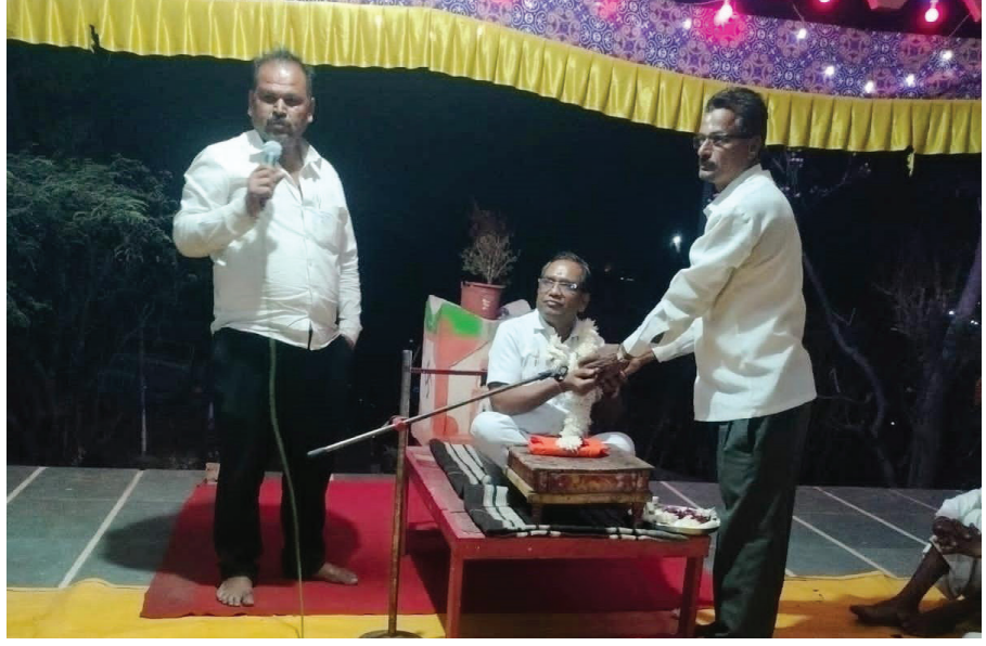
उरुळी कांचन (दै. आरंभ पर्व) जगातील सर्व धर्मग्रंथ हे मनुष्य

जातीच्या कल्याणासाठी असून साधुसंतांच्याद्वारे ह्या ग्रंथातील